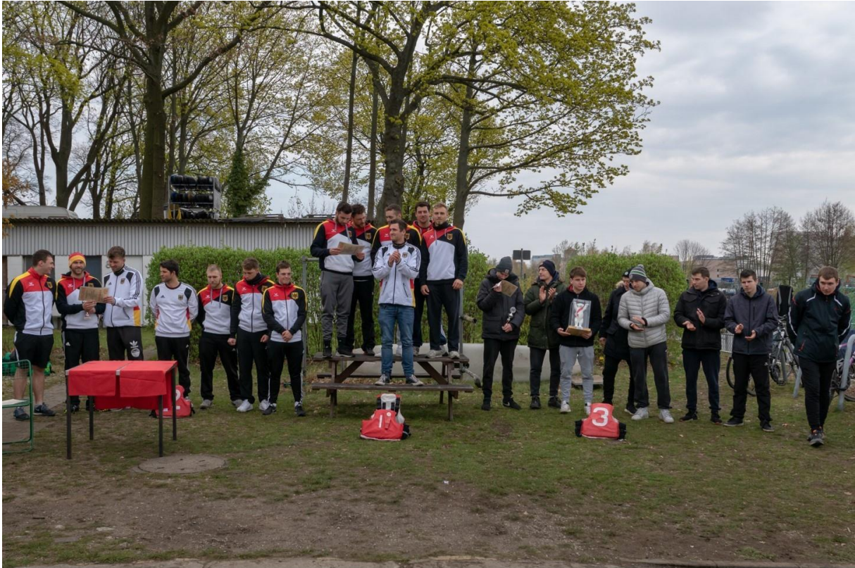
Siegerehrung Herren LK 1