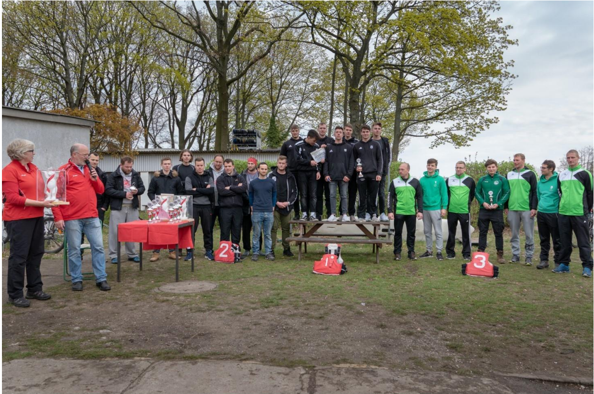
Siegerehrung Herren LK 2